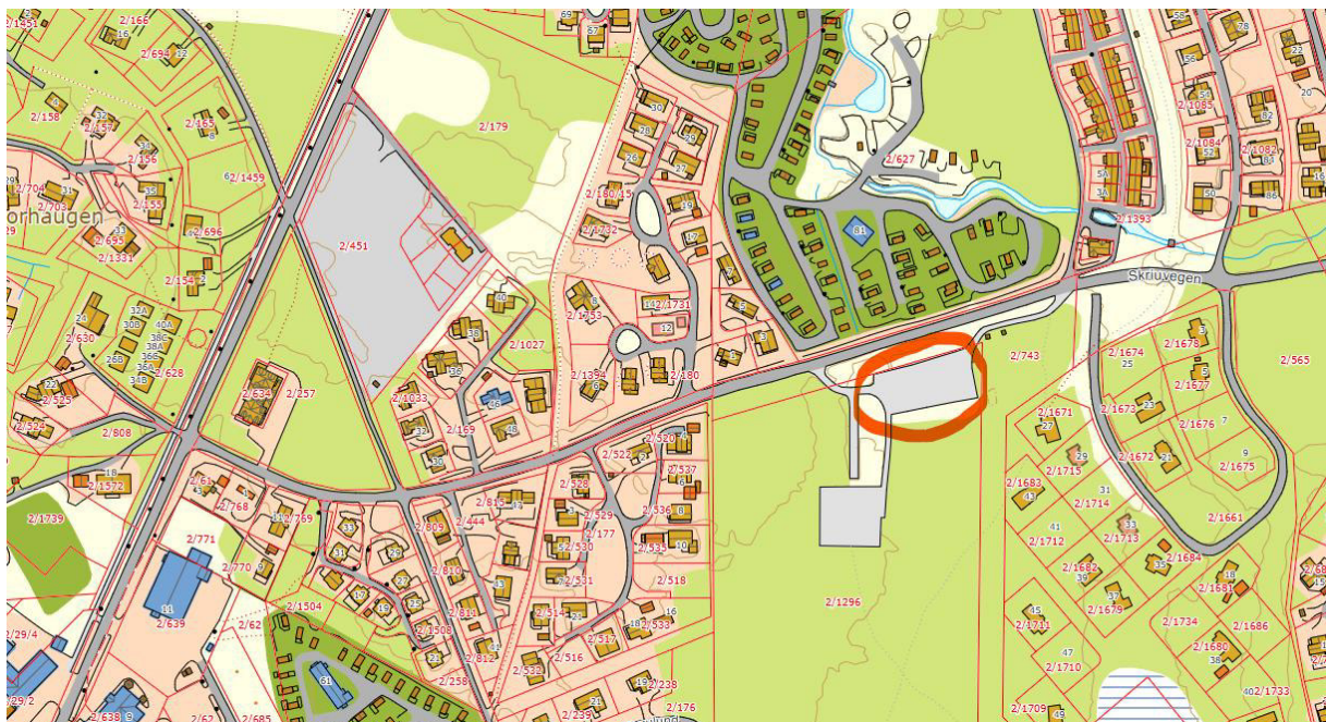
Fig 1 Skriuvegen

Lesja kommune arbeider med å legge til rette for at fritidsbeboerne i kommunen skal kunne sortere og levere sortert avfall på mindre sorteringsstasjoner. Dette arbeidet starter på Bjorli, der de fleste fritidseiendommene i kommunen er. Folk er godt vant til å sortere avfallet sitt hjemme, og ønsker å sortere også når de er på hytta. Kommunen planlegger to selvbetjente sorteringsstasjoner, en ved Skriuvegen og en ved Bjorli Miljøstasjon. Containerne som står der i dag, vil bli byttet ut med nye containere for ulike fraksjoner av avfall. Det skal tilrettelegges for enkel inn- og utkjøring på sorteringsplassen. Det vil komme mer informasjon etter hvert.