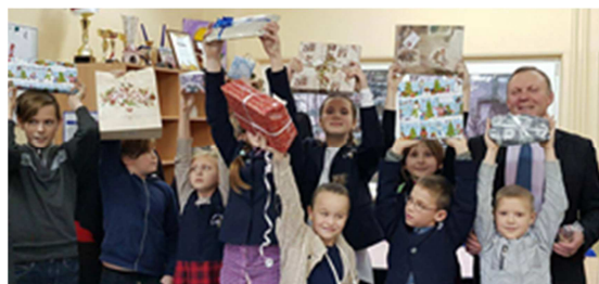
Glade barn med julegåver frå Lesja

Ta kontakt om det er spørsmål. Martin: 900 95 301