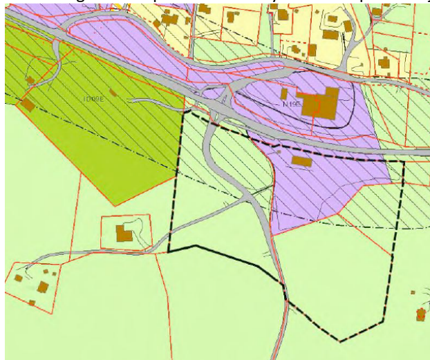
Figur 2. Utsnitt av kommuneplanens arealdel med omriss av reguleringsgrense for nytt Lyftingsmo næringsområde markert med stiplet linje.

I kommuneplanens arealdel (2013) er området avsatt til næringsformål og LNFR (landbruk- natur- og friluftsliv). Det ligger også gul og rød støysone fra E136 i de nordligste områdene. Deler av området er regulert tidligere langs med europavegen og ned Lyftingsmovegen i forbindelse med utbedring av vegkrysset med Reguleringsplan for trafiksikkerhetstiltak langs E136 ved Lyftingsmo ble vedtatt 18.06.15. Området er også spilt inn som næringsareal til prosessen om ny kommuneplan i Lesja.