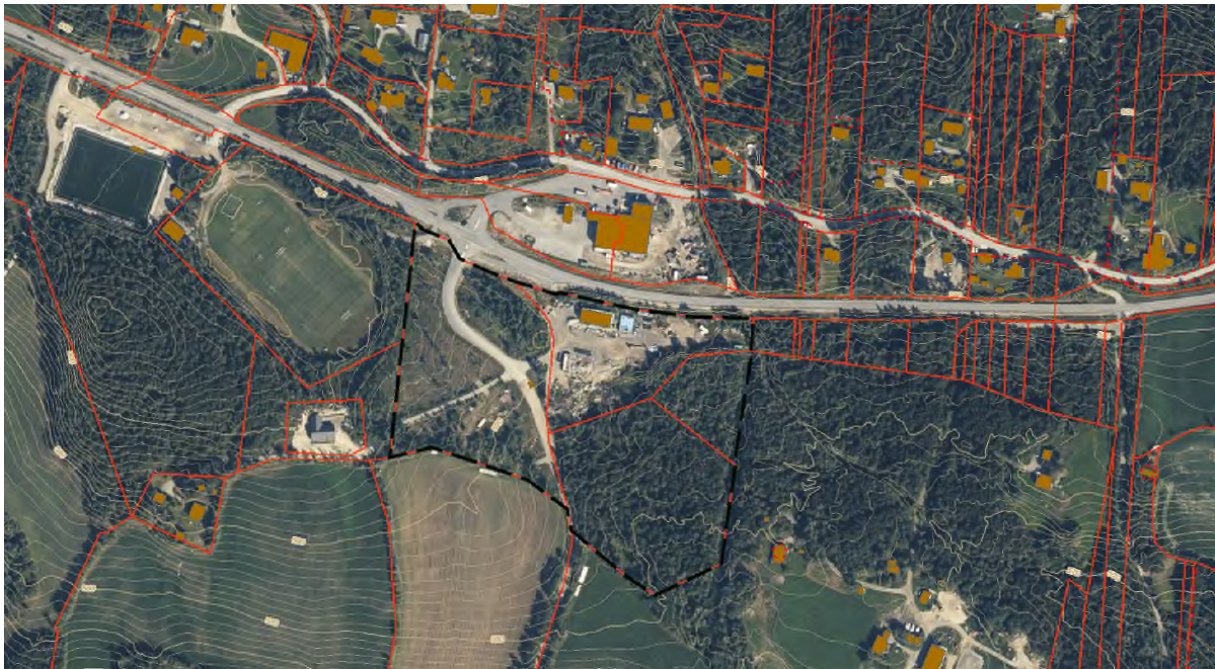
Figur 1. Figur som viser planområdet med sort stiplet linje.