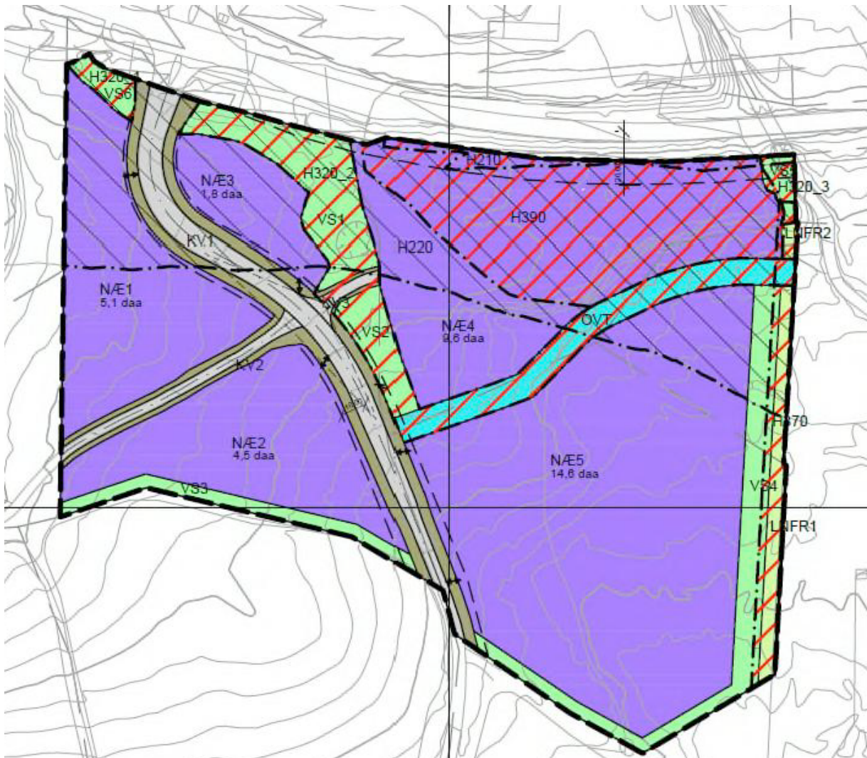
Figur 3. Figuren viser utsnitt av plankartet. Blått er næringsareal, grått, vegformål, grønt vegetasjonsskjerm. Skravurer ulike hensynssoner. OVT (overvannstiltak).