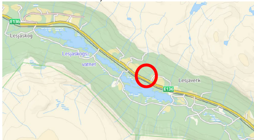
Figur 1: Visar lokaliseringa til planområdet, markert med raud sirkel.

Arealet for ynskja fjelluttak ligger i kommuneplanen til LNFR-formål (landbruks-, natur- og friluftformål samt reindrift)