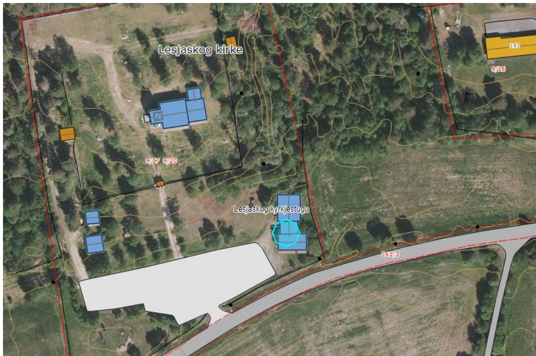
Flyfoto – Lesjaskog Kyrkjestugu