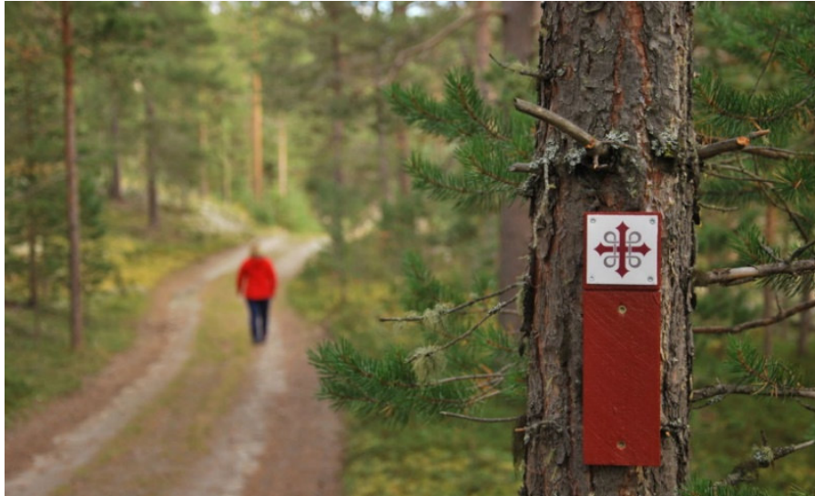
Langs Gamle Konge veg, Lesjaverk

Valldalsleia - pilegrimsleia frå fjord til fjell