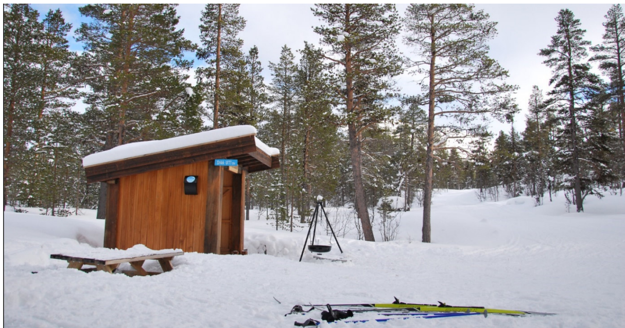
Foto frå Brøstdalsløypa.

Det er ført opp mange gapahukar i Lesja kommune ved turmål for både sommar og vinter.