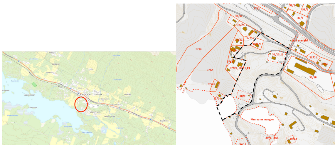
Figur 2. a) viser planområde i østenden av Lesjaskogsvannet med rød sirkel. b) planens grense vist med stiplet linje (kartfigur fra planprogram, Norconsult AS 2022).

Planforslaget vil regulere et område på ca. 24,6 dekar sør for E136 Romsdalsvegen på Lesjeverk. Planområdet er lokalisert ved krysset mellom Kolbotnvegen og Verksvegen. Foreslåtte planområde omfatter deler av gnr./bnr. 38/1 m.fl. samt eiendommene 38/1/5, 38/10,12 og 38/9. Plangrensen er trekt ut i Lesjaskogsvannet, for å regulere inn faktiske forhold med mer.