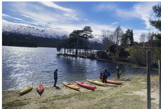
Figur 3. Bilde av stranda innenfor planprogrammet.

I planprogrammet omtales område som: "Planarbeidet tar sikte på å avklare forholdene ved badeplassen og hva som skal skje videre med bruk og ansvar og drift for dette området." Området er i dag mer enn kun en badeplass og dette må også avklares i planen og ha en god prosess på.