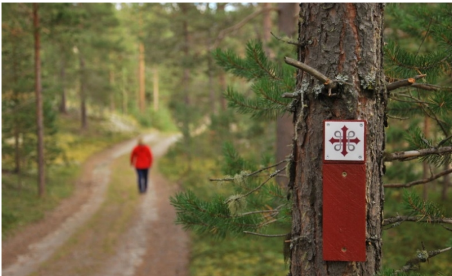
Foto: Langs Gamle Konge veg, Lesjaverk

Valldalsleia - pilegrimsleia frå fjord til fjell