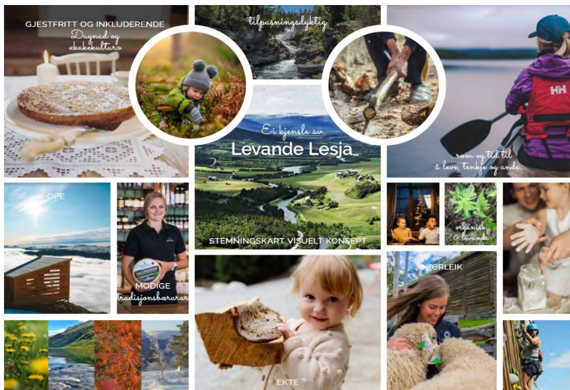
Stemningskart Krible design AS