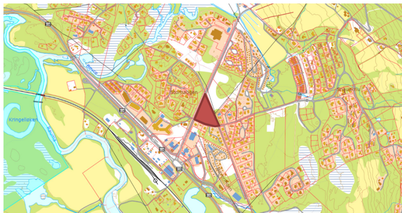
Figur 1. Oversiktskart over området. Bjorlitunet markert med mørk raud.